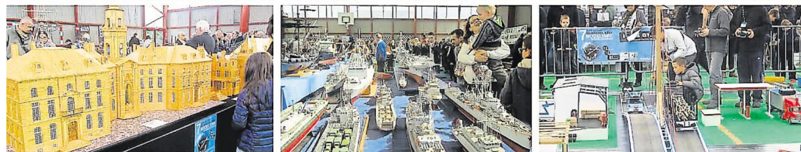
Différentes démonstrations ont ravi les passionnés comme les simples promeneurs. Un championnat de voitures téléguidées était proposé aux enfants. L'hôtel de ville de Rennes, ou plutôt sa représentation en allumettes, a attiré les curieux. Un espace était dédié aux bateaux, un autre aux camions.