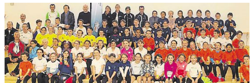
La rencontre d'athlétisme a réuni 80 poussins du groupe sud du département.

Au complexe sportif Rémy-Berranger, le club d'athlétisme a reçu, samedi matin, ses homologues de Bain-de-Bretagne, Guichen-Pont-Réan, Janzé et Redon (groupe sud), pour une rencontre qui a réuni 80 poussins.