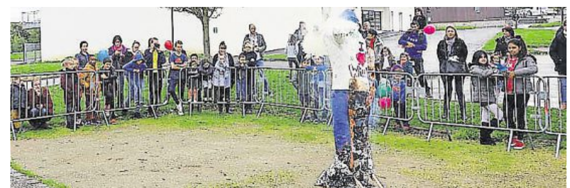
Le bonhomme d'hiver a brûlé sous les yeux des passants.

Samedi, l'espace jeunes a organisé la journée Venez buller, autour de la salle Louis-Texier.